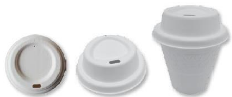
Kubki i wieczka - Eko trzcina